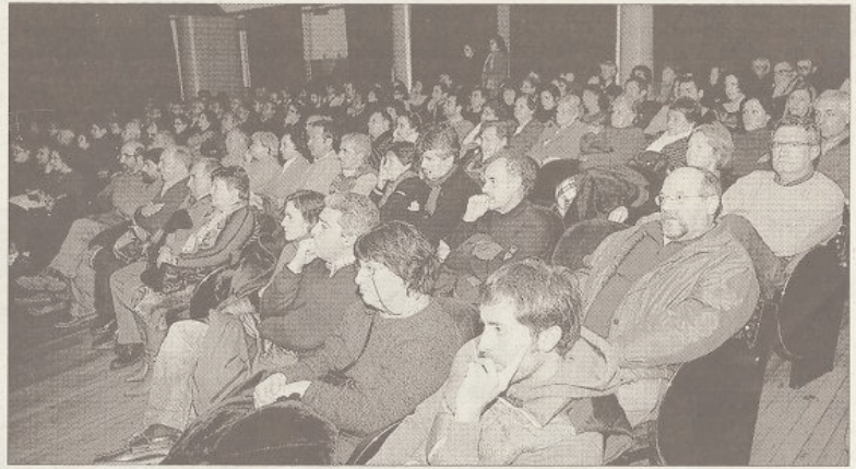
El público abarrotó el teatro.

Los promotores alertaron ayer de la existencia de varias "amenazas" para la conservación de este ámbito, como son el proyecto de instalación de un polígono industrial en el monte comunal de San Xulián, en Marín, o la ampliación de la franja de seguridad de la Brilat que afecta directamente a las comunidades de montes de Lourizán y Salcedo y de Vilaboa.